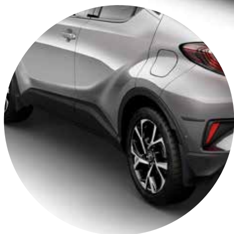
Stænklapper for og bag