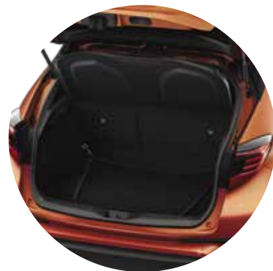
Bagagerumsnet til bunden